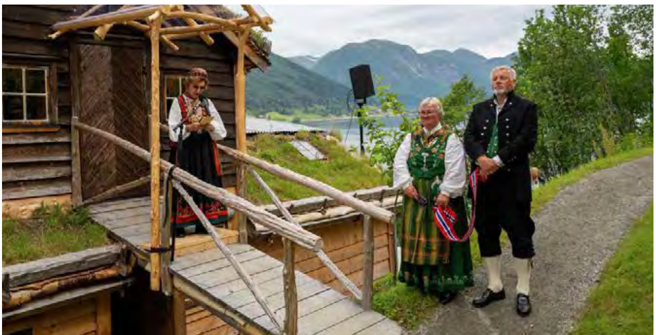
Opningstala til Hennar Majestet Dronning Sonja ved nyopninga av Astruptunet 22. juni 2024