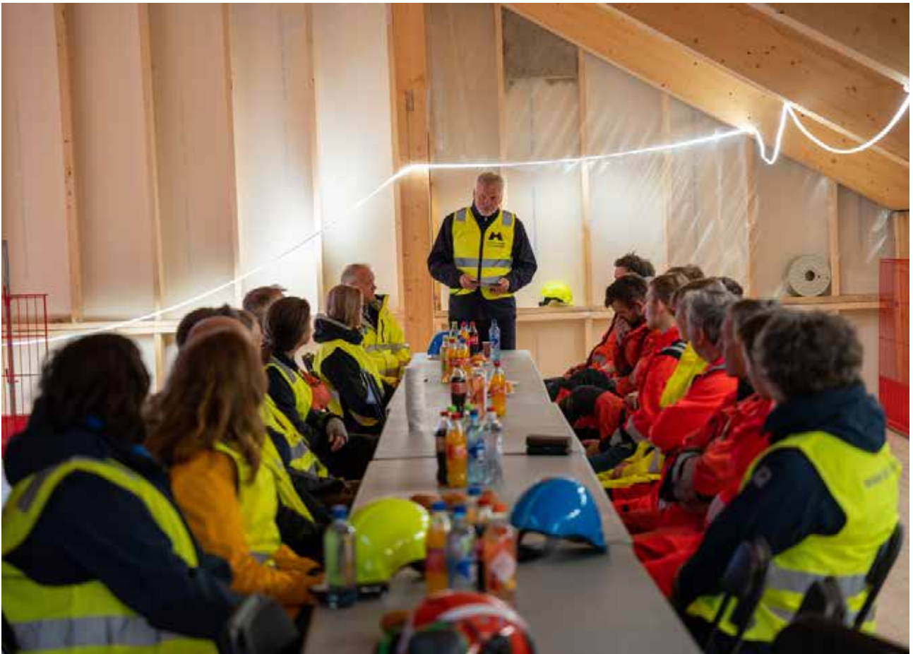
Kranselag: Taket er tett og byggherren feirar saman med entreprenøren, underleverandørane og dei som jobbar på bygget.