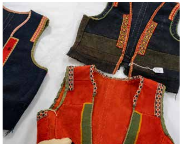
Registrering av folkedraktliv.