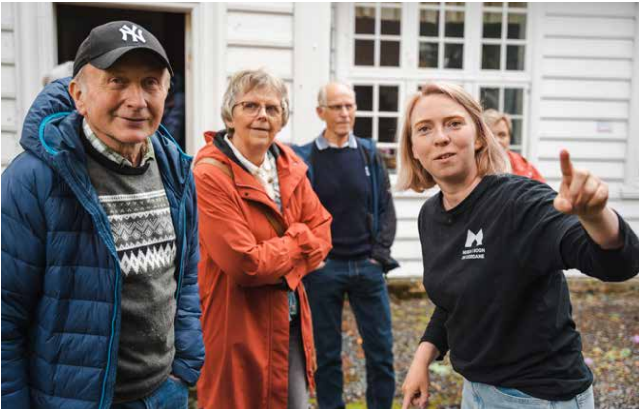
Besøkjande får omvising i krambua på Vågsberget.