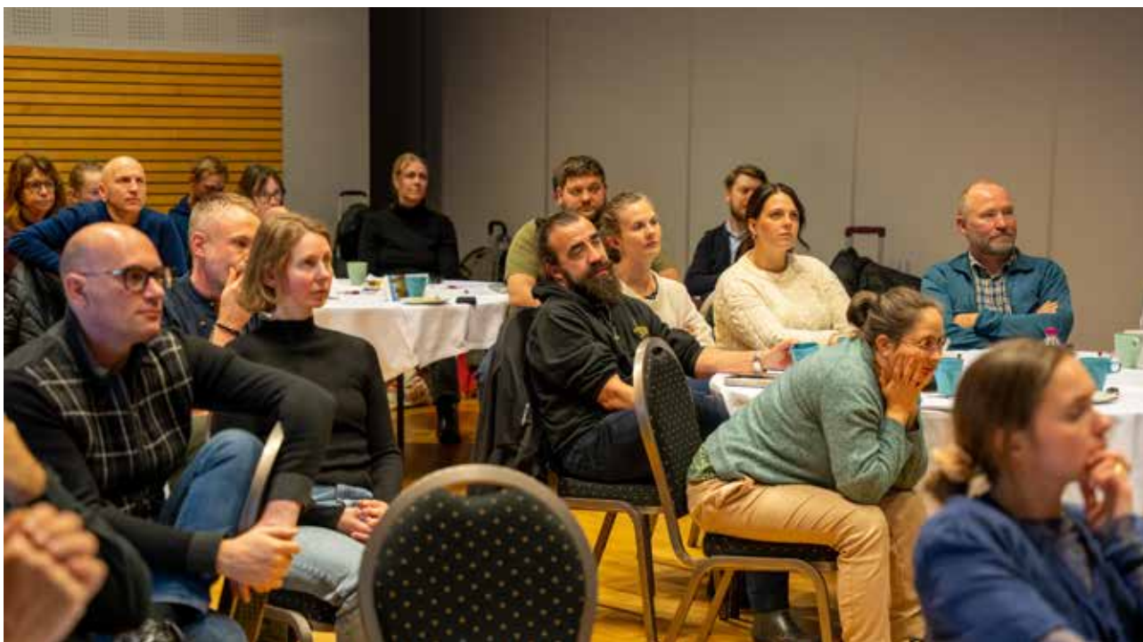
Konsentrerte lyttarar på personalsamlinga i Balestrand.

og at synlegheita vår kanskje er noko sterkare enn tidlegare. Vi har delteke på nettverkssamlingar, på rekrutteringsmesser på ulike stader i og utanfor fylket, og gjennomført ulike tiltak innanfor arbeidstrening/jobbprøving/hospitering o.l. – eit samfunnsansvar som vi tek på høgste alvor og ønskjer å halde fram med dei kommande åra. Tiltak som synleggjer kven vi er og kva moglegheiter som finst hjå oss, er viktig og eit prioritert område på HR-sida.