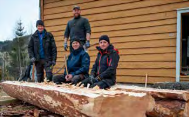
Arbeidsgjengen frå Sunnfjord Museum, Nordfjord Folkemuseum og De Heibergske Samlinger.

no skal vi lage ein kopi til nyopninga av bygget og 100-års-jubileet til Sunnfjord Museum i 2026. I dette arbeidet har vi nytta same framgangsmåten som då den opphavelige senga blei tilverka, og slikt arbeid har synt seg å vere særst eigna til formidling av tradisjonshandverket som handverkarane våre fører vidare.