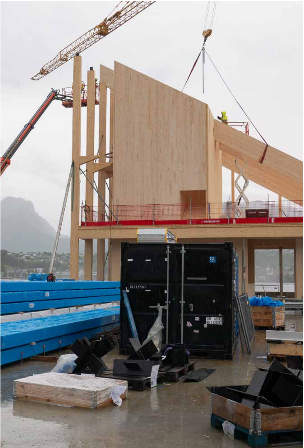
Nybygget til Holvikejekta reiser seg.