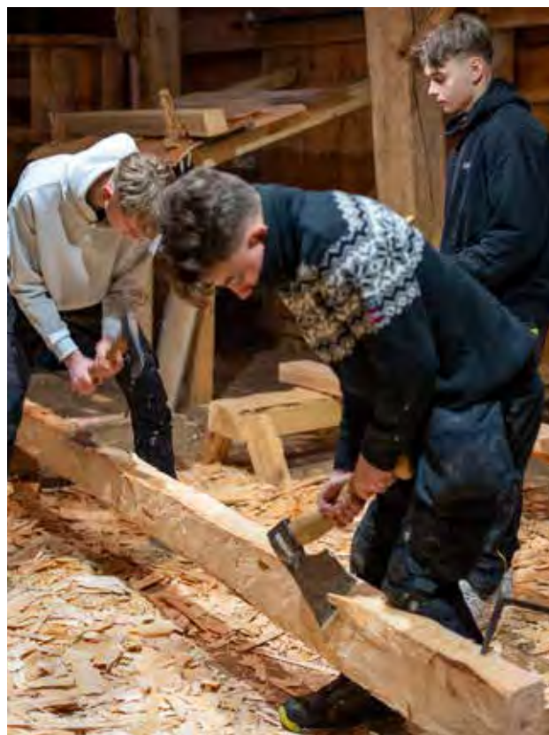
Elevar ved Førde vgs, vg2 tømrar, besøker Sunnfjord Museum for å få ein introduksjon til tradisjonelle handverksteknikkar og reiskapar.

Vi hadde høg score i medarbeidarundersøkingane innanfor både trivsel, motivasjon og arbeidsmiljø. Vi jobbar stadig med tiltak for å sikre at dette held seg på eit høgt nivå.