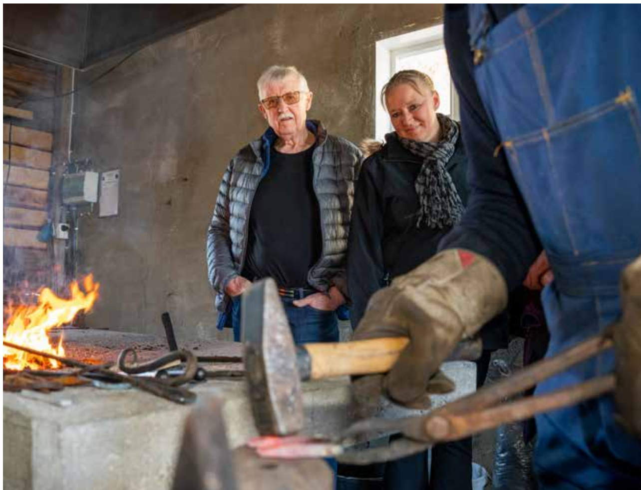
Smeden i aksjon på vårslepp på Nilsenslippen