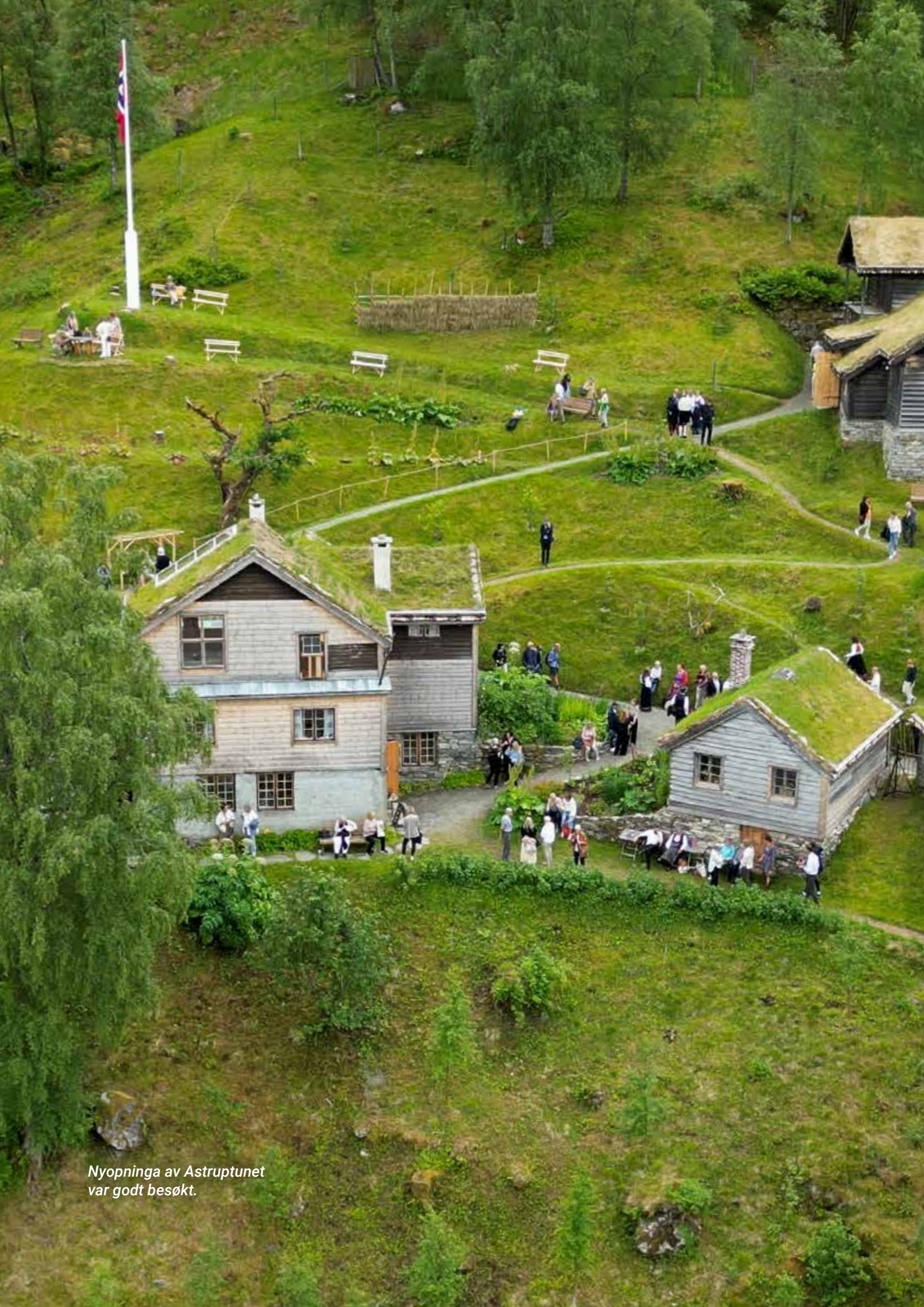
Nyopninga av Astruptunet var godt besøkt.