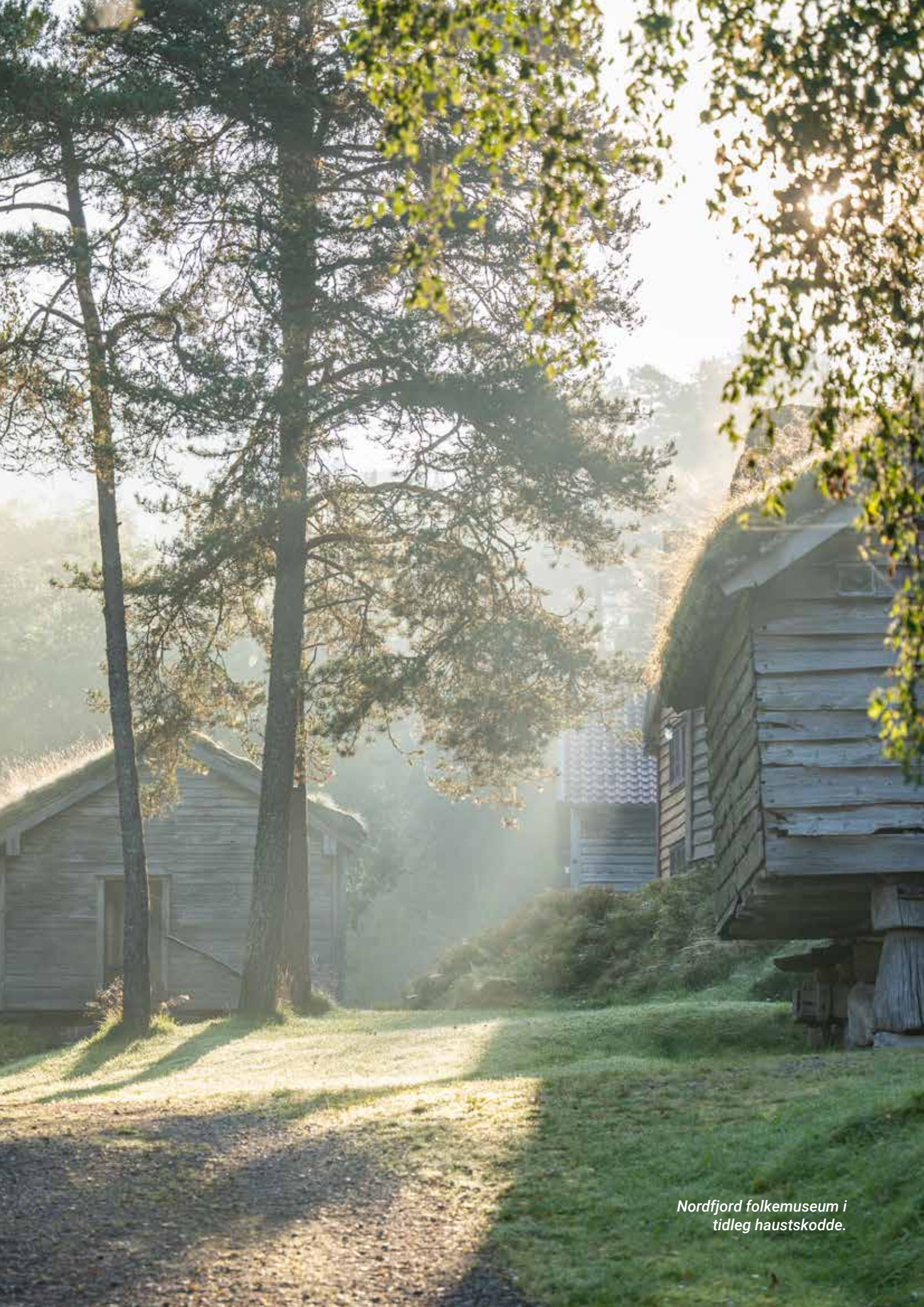
Nordfjord folkemuseum i tidleg haustskodde.