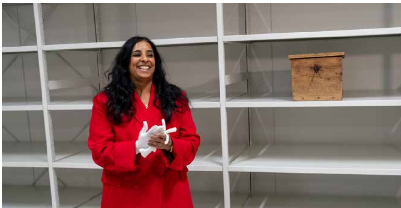
Kulturminister Lubna Jaffery plasserer den første registrerte gjenstanden til Sunnfjord Museum, eit skrin frå Stardalen i Jølster, i magasinet.

Overtakinga av Tinghuset i 2024 markerte eit tidsskilje for Musea i Sogn og Fjordane. Prosessen med å sikre gode magasintilhøve for samlingane ved musea i gamle Sogn og Fjordane fylke går attende til lenge før etableringa av den konsoliderte stiftinga i 2009.