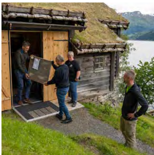
Dei nyinnkjøpte måleria til Sparebankstiftinga Sogn og Fjordane blir overlevert til galleriet.

Etter fleire år med arbeid på både bygg, hage og anlegg blei det ein markant oppsving i publikums-talet. Over 7 000 besøkjande var innom Astruptunet i løpet av 2024. Restaureringa var mogleggjort av Sunnfjord kommune og Sparebankstiftelsen DNB med ei økonomisk ramme på 46 millionar.