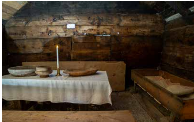
Ei julepynta Otneimstove på Nordfjord Folkemuseum.

Alle dei tre folkemusea hadde miljøutstillingar i kulturhistoriske bygningar som formidla tradisjonelle juleinteriør og -skikkar gjennom fleire hundreår. På Nordfjord Folkemuseum og Sunnfjord Museum sette vi i tillegg opp utstillingane «Jul i bondesamfunnet» og «Rundt om en enebærbusk», begge produsert av dei tilsette på musea.