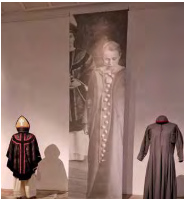
Frå draktutstillinga under landslovsmarkeringa på Eikaasgalleriet.

I 2024 blei den 750 år gamle landslova etter Magnus Lagabøte markert over heile landet. Lova blei lansert i Bergen i 1274 og er eit sentralt verk i både europeisk og norsk rettshistorie.