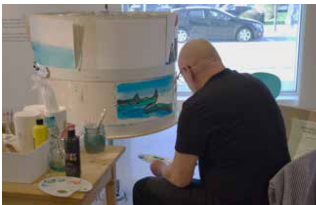
Ein gjest prøver seg på hurtigmåling, slik Stranda-målarane gjorde.

Kunstmuseet har også husa to utstillingar som del av samarbeid med Vestlandsutstillingen og Kunstnarsenteret i Sogn og Fjordane. Sistnemnde har nyleg blitt etablert, etter at Kunstmuseet i ei årrekke tok hand om kunstsenterdrifta for den nordlege delen av Vestland fylke. Utstillinga «Mønstring» er den første produksjonen til Kunstnarsenteret, og utstillinga opna i november.