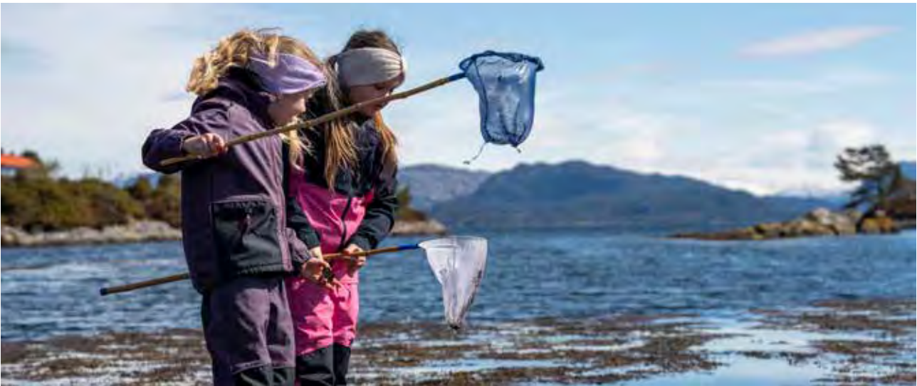
Ungar utforskar fjæra på Kystmuseet i Sogn og Fjordane.