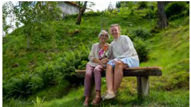
Mange besøkande tok turen til Astruptunet etter nyopninga.

Etter at Astrup-utstillinga på SFKM var over i september 2023, fekk vi moglegheit til å ta mange av dei innlånte verka frå Sparebankstiftelsen DNB og Kode vidare til galleriet i Astruptunet for den store nyopningsommaren. Utstillinga «Naturens gåve» var såleis fylt med høgdepunkt som Marsmorgen , Revebjeller og Epletre i blomst . Vi fekk også ei gledeleg overrasking i forkant av nyopninga, då Sparebankstiftinga Sogn og Fjordane melde at dei hadde kjøpt to Astrup-måleri på auksjon i juni. Dei to måleria, Trollebotten og Sankthansbål ved Jølstravannet , blei lånt ut til oss og raskt montert i galleriet som del av utstillinga.