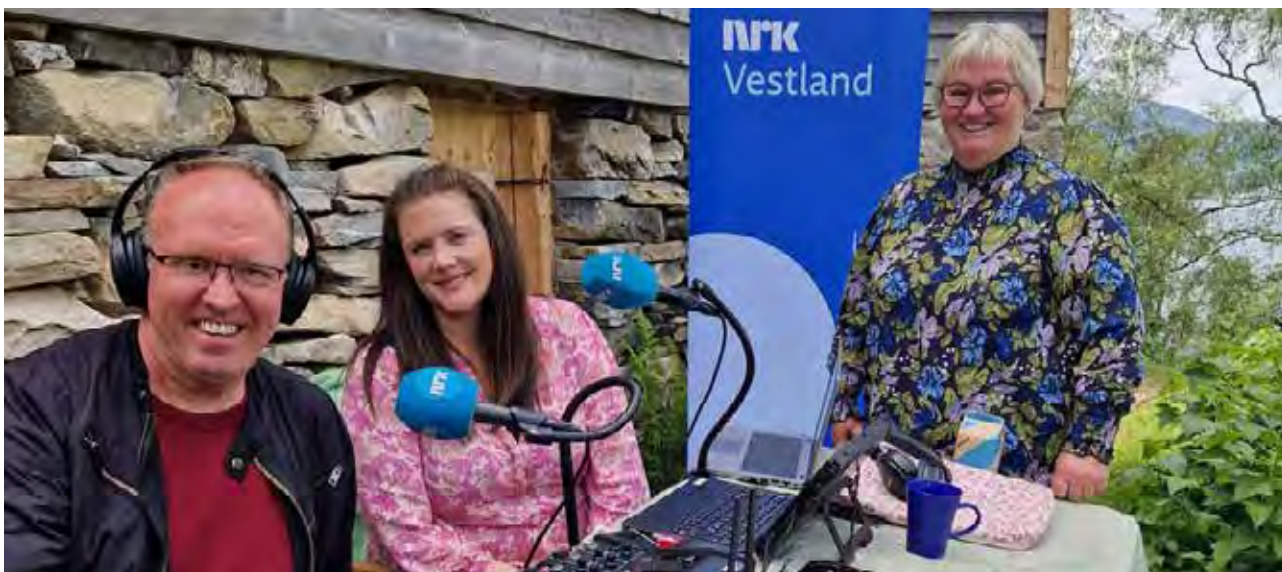
NRK Sogn og Fjordane hadde sending frå Astruptunet.

Den viktige trafikken på nettsida auka med 31 prosent i 2024. 82 000 unike brukarar sytte for 91 000 økter og 210 000 sidevisingar og brukte i snitt over 4 minutt på kvart besøk. Det er hovudsakleg stoff i kategoriane opplevingar og nyheiter som får lesarar. Hovudvekta av trafikken kjem via Google-søk. I 2024 fekk vi på plass betre filmvising, moglegheit til å krysspublisere nyheitssaker på tvers, tiltak for å leie lesarane vidare til meir innhald, og dessutan tryggingstiltak som oppgradert programvare for nettsida og to-faktor-autentisering.