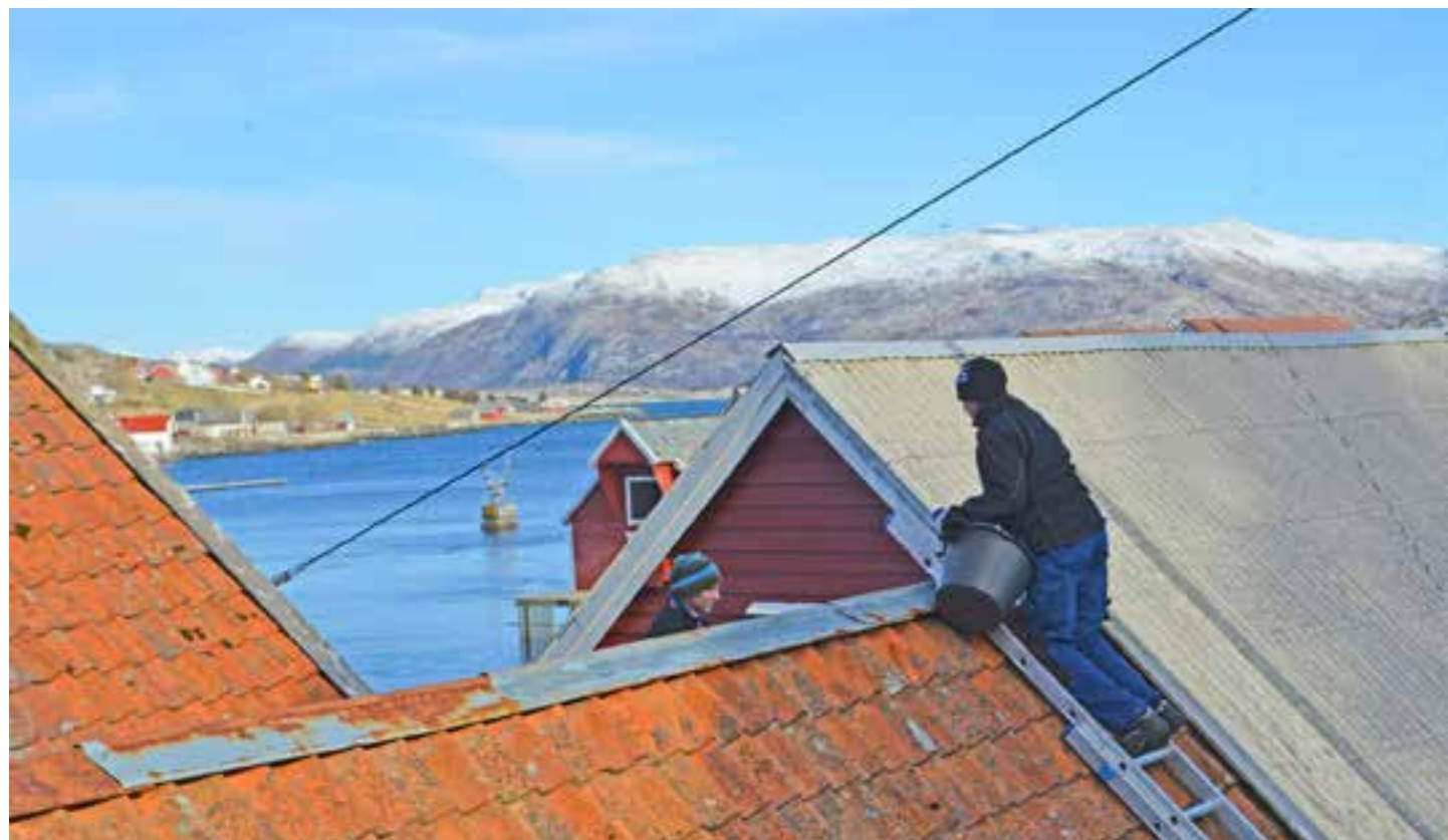
Kystmuseet har utfordringar med forvaltning av store bygg lokalisert i fleire kommunar i regionen. Utfordringane er ikkje blitt mindre med auka klimaendringar. MiSF har deltatt i det nasjonale prosjektet «Felles innsats for å møte klimautfordringane». Her er ein i gong med reparasjon av taket på Lisethbua i Kalvåg i Bremanger.