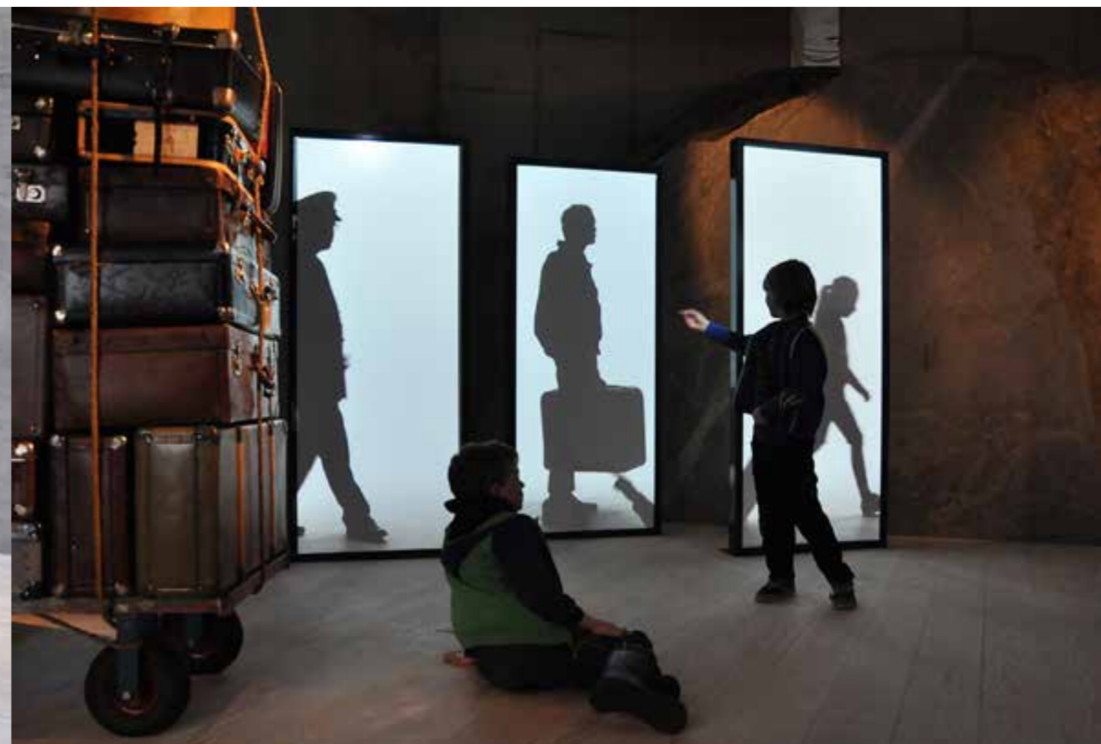
Den faste utstillinga om norsk reiselivshistorie er formidla både ved bruk av tradisjonelle pedagogiske verkemiddel og ny teknologi. Eit eige utstillingsrom syner utviklinga av Balestrand som reiselivsbygd, og i areal for skiftande utstillingar syner Nasjonale turistveggar ei utstilling knytt til viktig infrastruktur for norsk reiseliv. Det er i stor grad nytta digital teknologi i utstillingsareala.