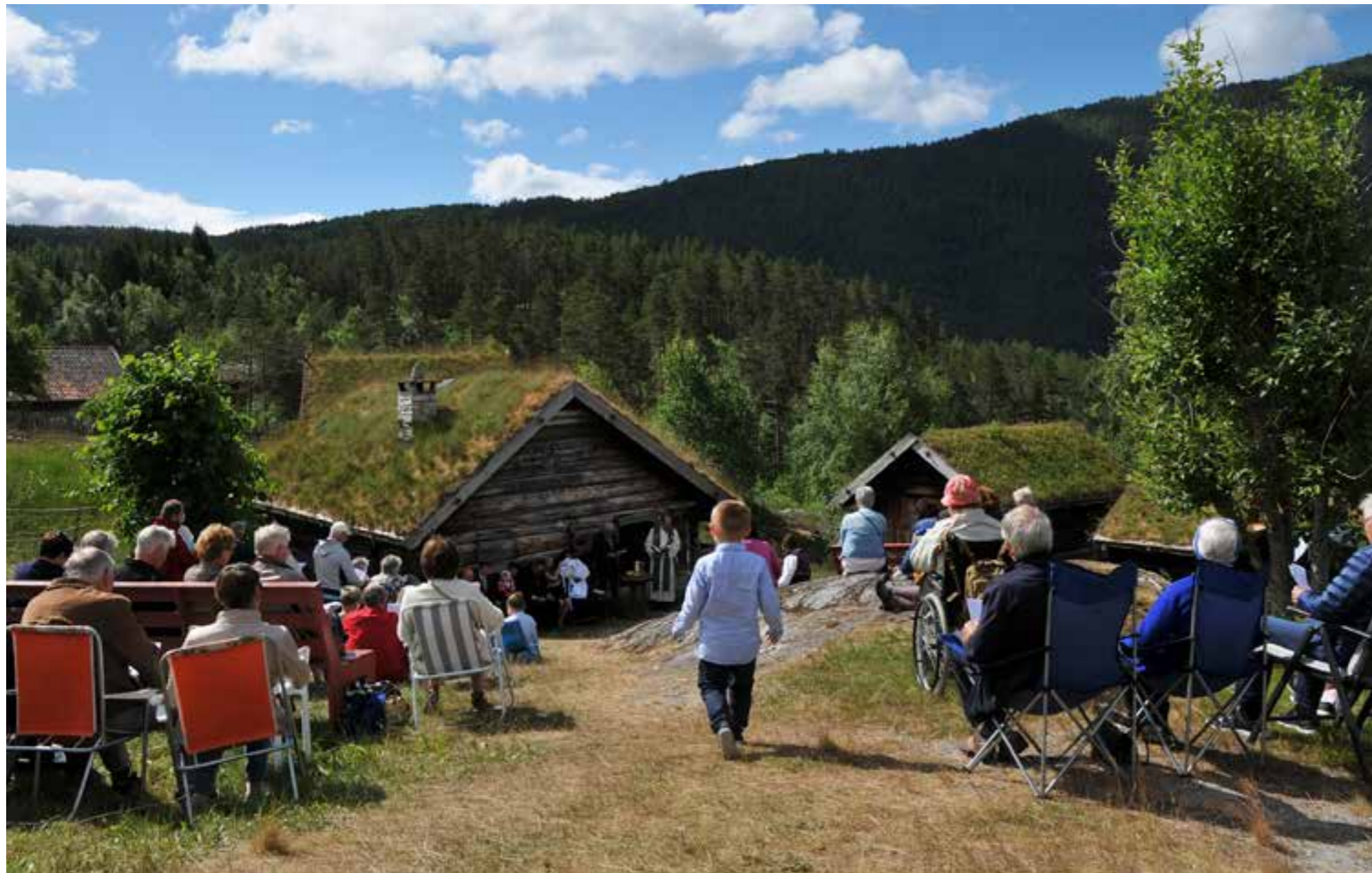
I samarbeid med kyrkjene i Sogndal og Kaupanger, vart det arrangert friluftsgudsteneste med dåp og kyrkjekaffi på DHS-Sogn Folkemuseum. I 2017 er det jubileum for reformasjonen og museet vil arbeide med tema knytt opp til kyrkja før og etter reforma. I 2017 er det 150-års jubileum for Sogndal kyrkje.