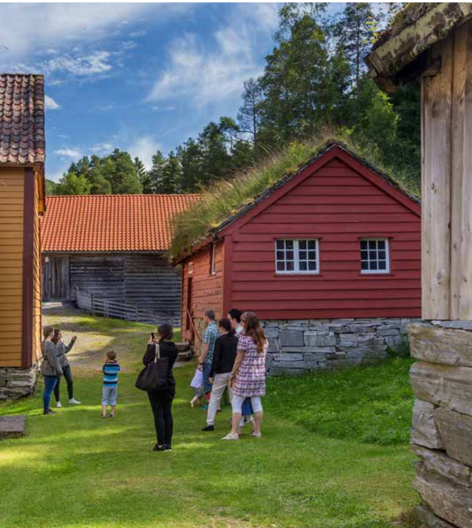
Nordfjord Folkemuseum er det yngste av dei tre folkemusea i MiSF. Museet har 45 bygningar som er flytta til museet frå bygdene rundt om i Nordfjord. Friluftsavdelinga syner korleis nordfjordingane levde og livnærte seg ut frå naturgrunnlag og tradisjon. I 2016 hadde museet tilbod om faste omvisingar to gonger om dagen i hovudsesonen.