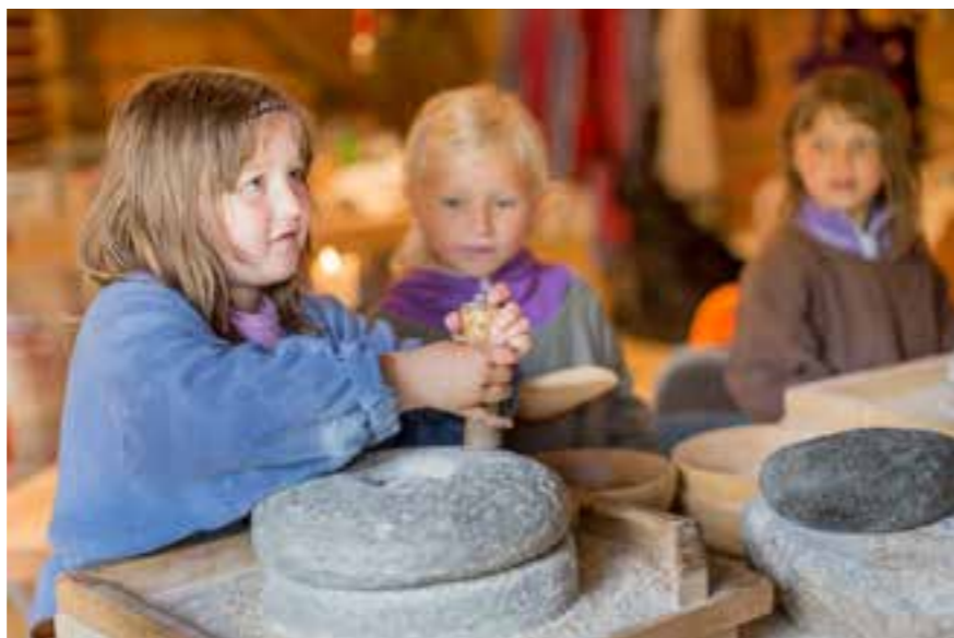
Her står to forventningsfulle jenter i kø for å få prøve ut korleis korn kan bli til mjøl på handkverna i Kvernsteinparken. Ein reiknar med at i Noreg vart handkverna avløyst av bekkverkerna i mellomalderen. Handkverna gjekk likevel ikkje i gløymeboka, ho levde vidare som reiskap til husbruk i fleire hundre år.

Musea i Sogn og Fjordane har i meldingsåret rekruttert 10 nye medarbeidarar; 4 handverkarar, 3 formidlarar, ein sekretær, ein avdelingsleiar og ein seniorrådgjevar museumsfag i nyoppretta stilling.