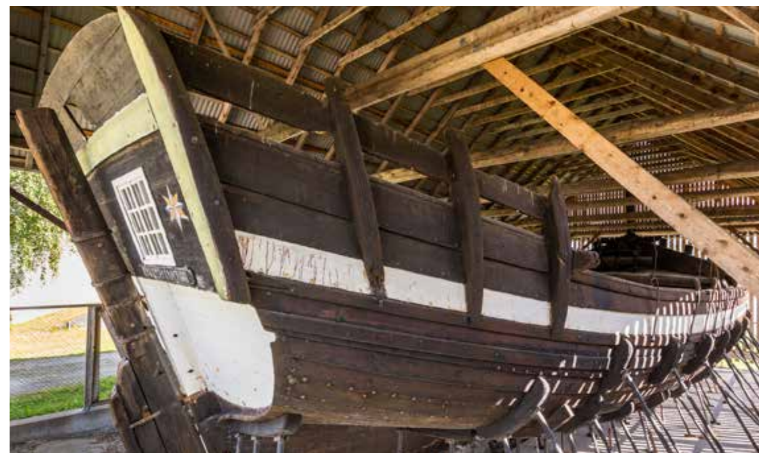
Holvikejekta, Nordfjord Folkemuseum.