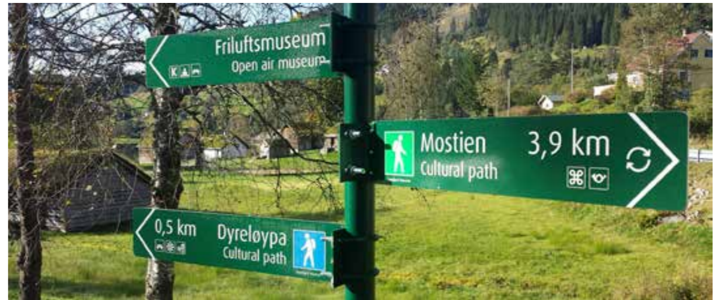
Skilting på museum kan vere ei utfordring for friluftsmusea med tanke på at dei ikkje skal vere skjemma i museumslandskapet, men samtidig skal dei vere gode vegvisarar for dei besøkande. Sunnfjord Museum har vore medviten ved val av skiltutforming, som er etter internasjonal standard.