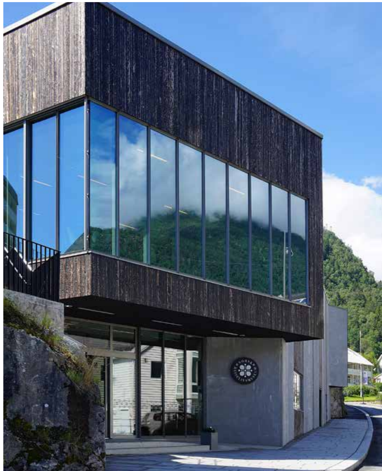
Bilete t.h.: Norsk Reiselivsmuseum er teikna av Askim og Lanto arkitekter. Det spektakulære bygget er skore ut i grunnfjellet, noko som er ein attraksjon i seg sjølv, og spesielle utstillingslokale med store estetiske kvalitetar. Nominerte til Statens byggeskikkpris, heidersprisen som blir gitt til bygg som medverkar til å «heve, fornye og utvikle den allmenne byggeskikken», og seinare vore nominert til fleire prisar.