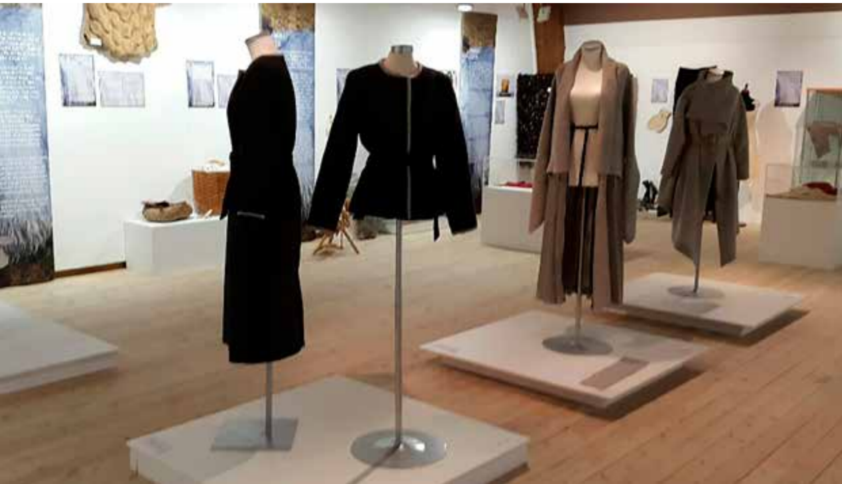
Frå ullstillinga Tradisjon og trend - norsk ull til alle tider. Sjølvprodusert utstilling som sto på Kystmuseet i Florø utover våren og som sommarutstilling på Vågsberget.