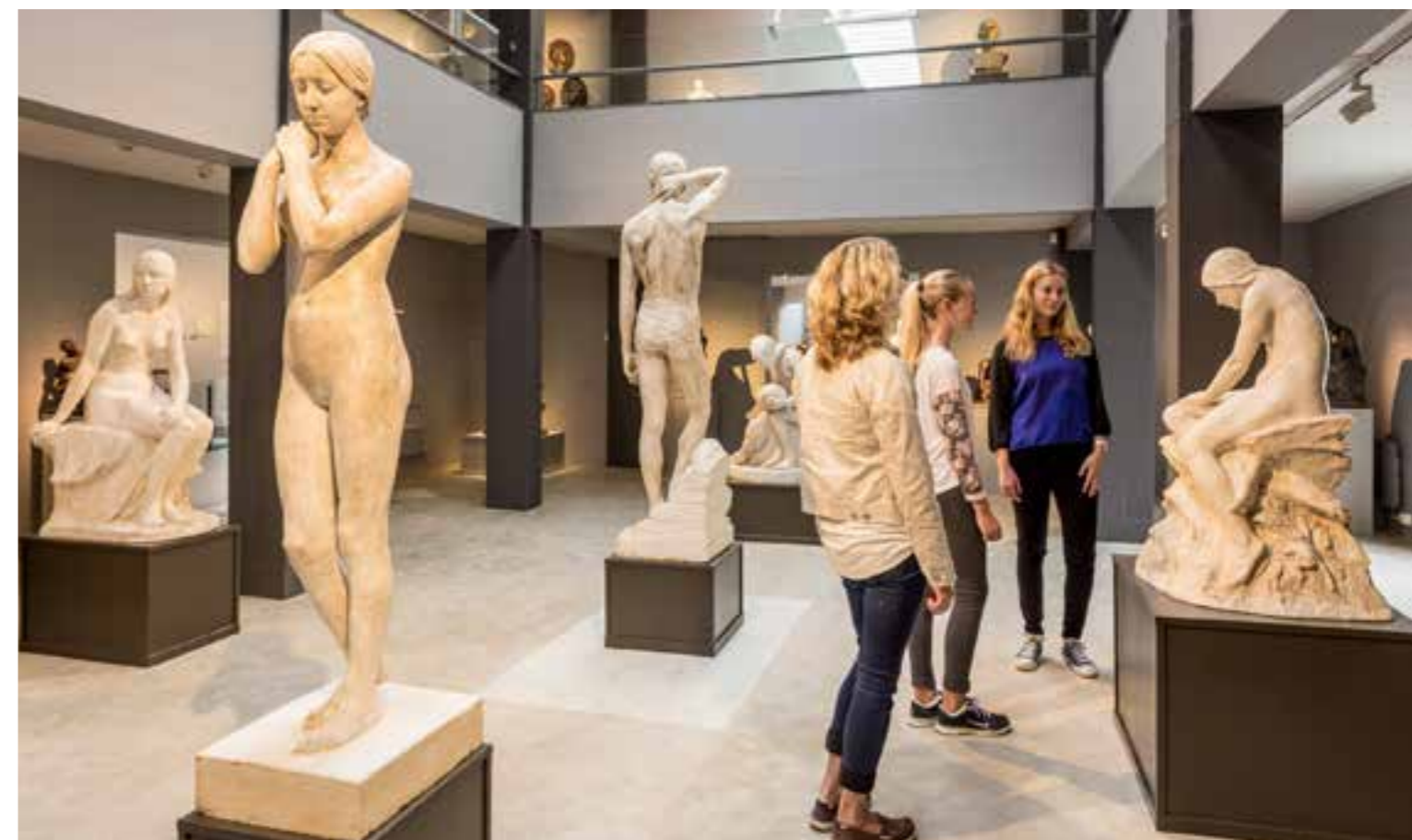
Anders Svor Museum.