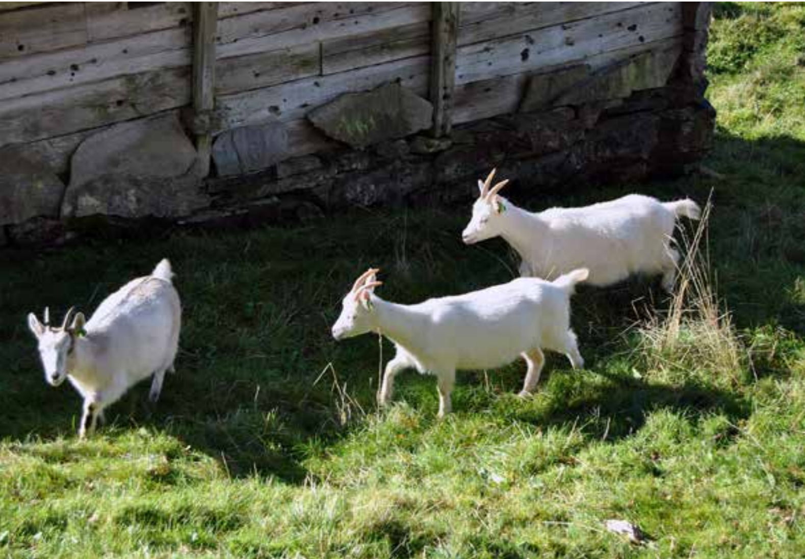
Fleire av musea leiger inn husdyr i sommarhalvåret. Dyra er til stor glede for dei besøkande og kan gjere eit godt arbeid i skjøtsel av kulturlandskapet. Her må det vere dei tre bukkane Bruse som har funne vegen til museumssetra der dei har tenkt å gjere seg feite.