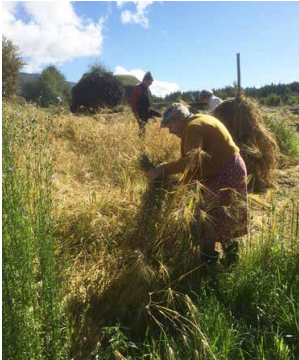
Frå den årvisse familiedagen på DHS-Sogn Folkemuseum med kornskjering. I det gamle bondesamfunnet var det kvinnene som skar og mennene sette kornet på staur. I over 30 år har museet arrangert familiedag den første søndagen i september og ulike arbeidsprosesser i gardsarbeid har vore demonstrert og besøkte har fått prøve seg.