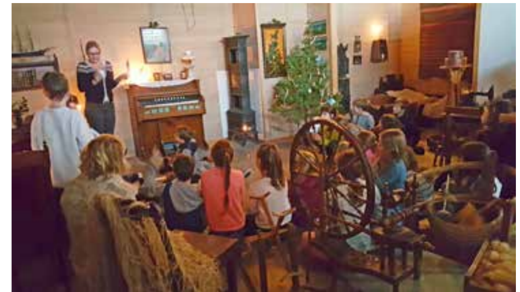
I desember var det eit eige tilbod om «Jul i gamle dagar» til alle 4.-klassingar i Flora kommune. Borna fekk delta i juleverkstaden og kystrissen kom på besøk. Her fortel formidlaren om jula i gamle dagar til lydhøyre born.

Gjennom den kulturelle skulesekken i Gloppen har avdelinga hatt tilbod for 5.klassar kalla «Film i sekken», i samarbeid med Gloppen kino. Dette er eit opplegg der elevane får omvising i museet si temporære utstilling etter kinobesøk. Avdelinga har også hatt andre peda-