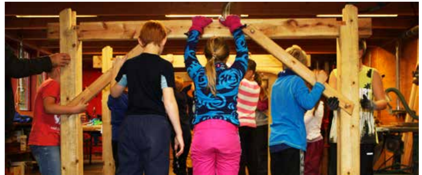
Born i full sving med eit byggesett på Sunnfjord Museum. I byggeskikk-undervisninga, får elevane ein teoretisk forberedelse før oppsetting av eitt grindbygg og eitt tømra hus. Museet har lagt til rette for at skuleklassar skal forstå meir av korleis ulike byggekonstruksjonar heng saman. Formidlingsopplegget er kalla «I eige hus – byggeskikk.»