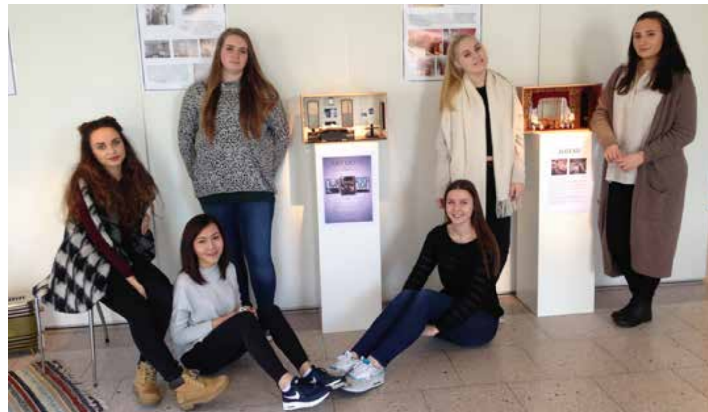
Elevar ved Eid vidaregåande skule, vg 2/Interiør og utstilling, laga historisk interiørutstilling på Nordfjord Folkemuseum våren 2016. Utstillinga hadde form av «tiitteskåp» og tekstplakatlar med eit stilhistorisk innhald av ulike tidsepokar for interiør.