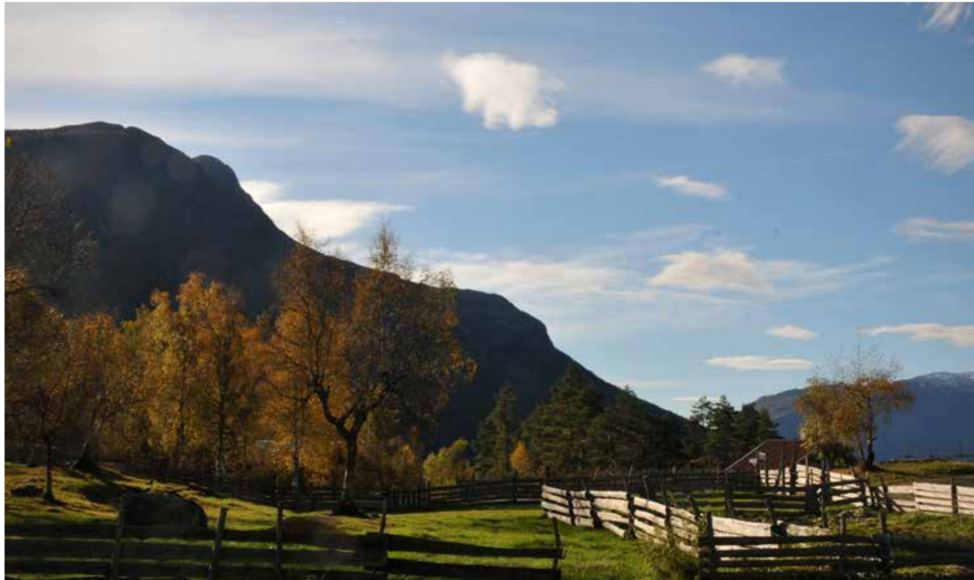
MiSF v/DHS-Sogn Folkemuseum, har ansvar for det nasjonale kulturlandskapsnettverket. Då museet flytta til Vestreim starta arbeidet med å dyrke opp utmark og utvikle ulike typar kulturlandskap. I samarbeid med Høgskulen på Vestlandet er museet med i forskingsprosjekt der ein forskar på engmark ved bruk av ulike skjøtselsmetodar.

lokale skulesekken i Bremanger kommune. Båten går turar ut frå Smørhamn.