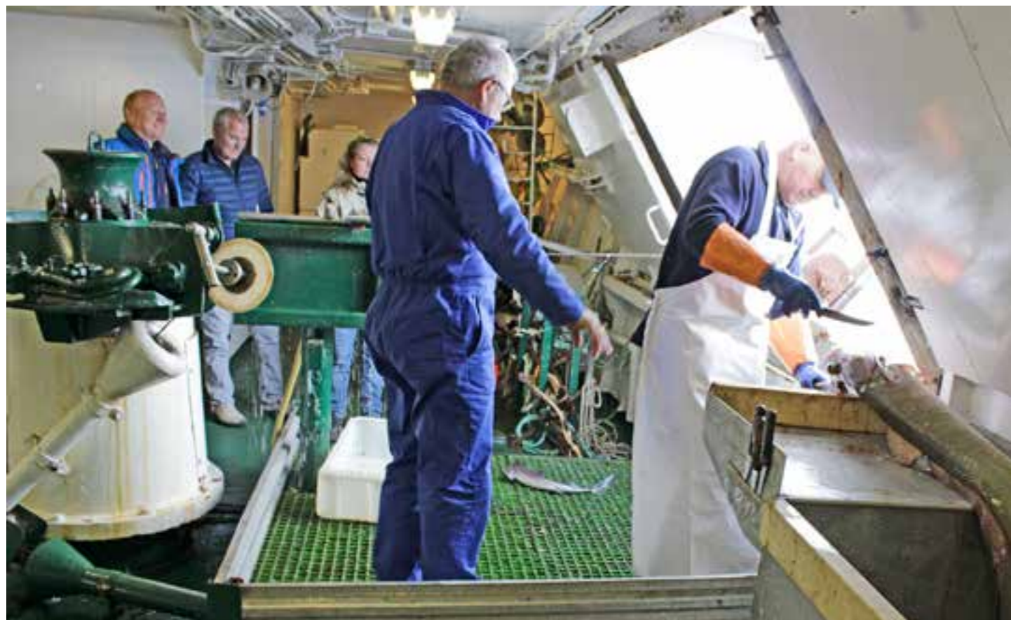
Kystmuseet brukar autolinebåten MS Haugefisk aktivt i formidlinga, m.a. gjennom den kommunale DKS i Bremanger. Båten blei tidlegare brukt til banklinefiske i Nordsjøen. Båten har fått tildelt «fritidsfiske -visningskvote» som m.a. vert brukt i undervisningsføremål. Her vert det vist korleis tradisjonelt linefiske vert gjort på ein autolinebåt.