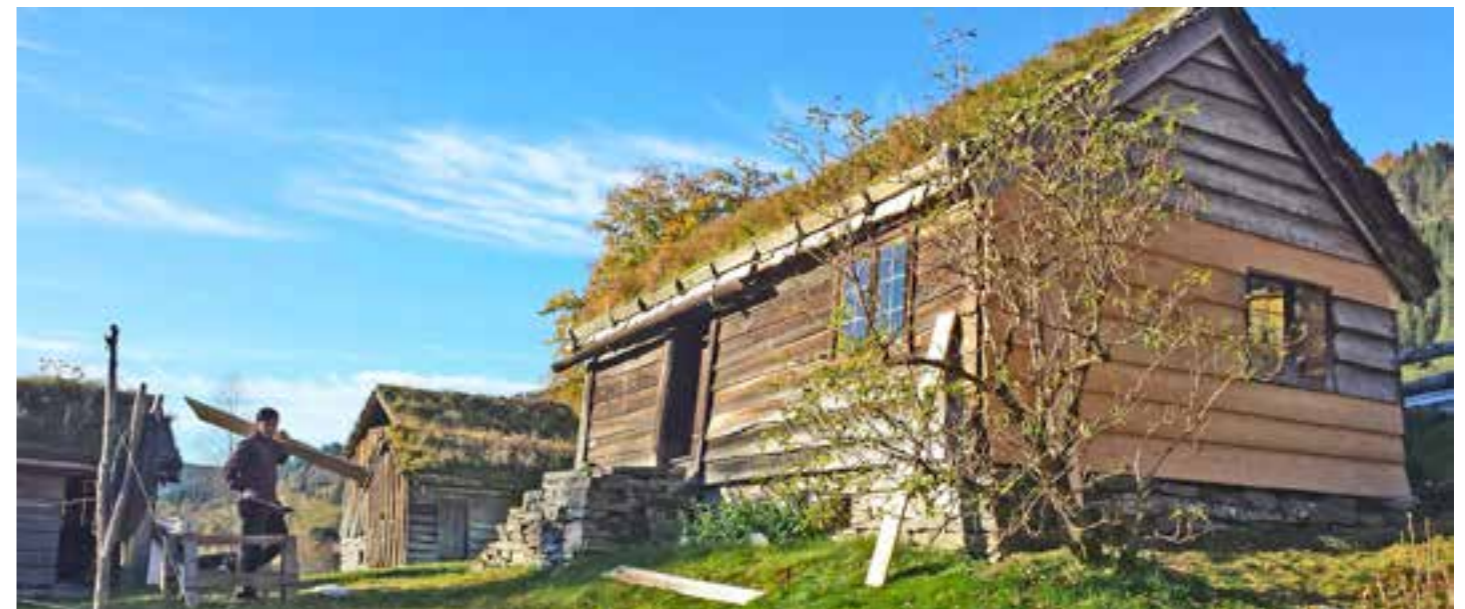
Husmannsplassen på Sunnfjord Museum var i Movika lenge før museet vart etablert. Den gongen var namnet Pladsen Movig, i dag vert bustadhuset kalla for Plasstova. Sist sommar vart kledning på endeveggen av Plasstova skifta.