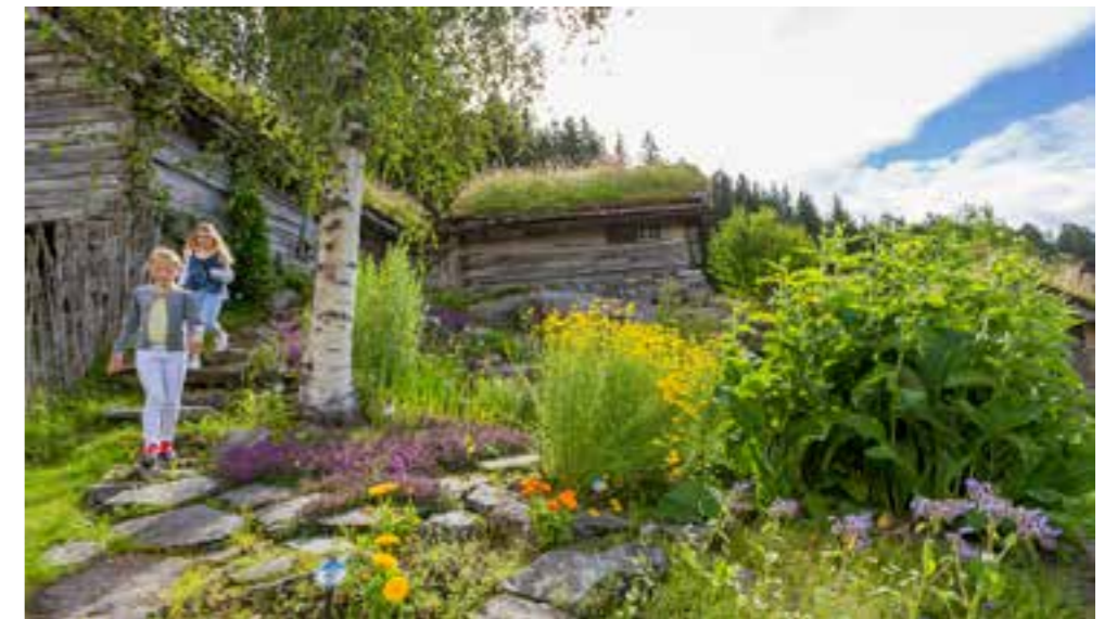
Musea i Sogn og Fjordane har eit vidstrakt areal av kulturlandskap, historiske hageanlegg, urtehagar med nyttevekstar, og skjøtsel og vedlikehald av desse areala er tidkrevjande. Enkelte avdelingar samarbeider med hagelag som har stor glede av å pleie museumshagen.

gogiske opplegg knytt til utstillingane «MuseumsTING», «Ja takk begge deler» og «Livreddaren», samt eit formidlingsopplegg i Selje knytt til 150 års jubileet for Selje kyrkje.