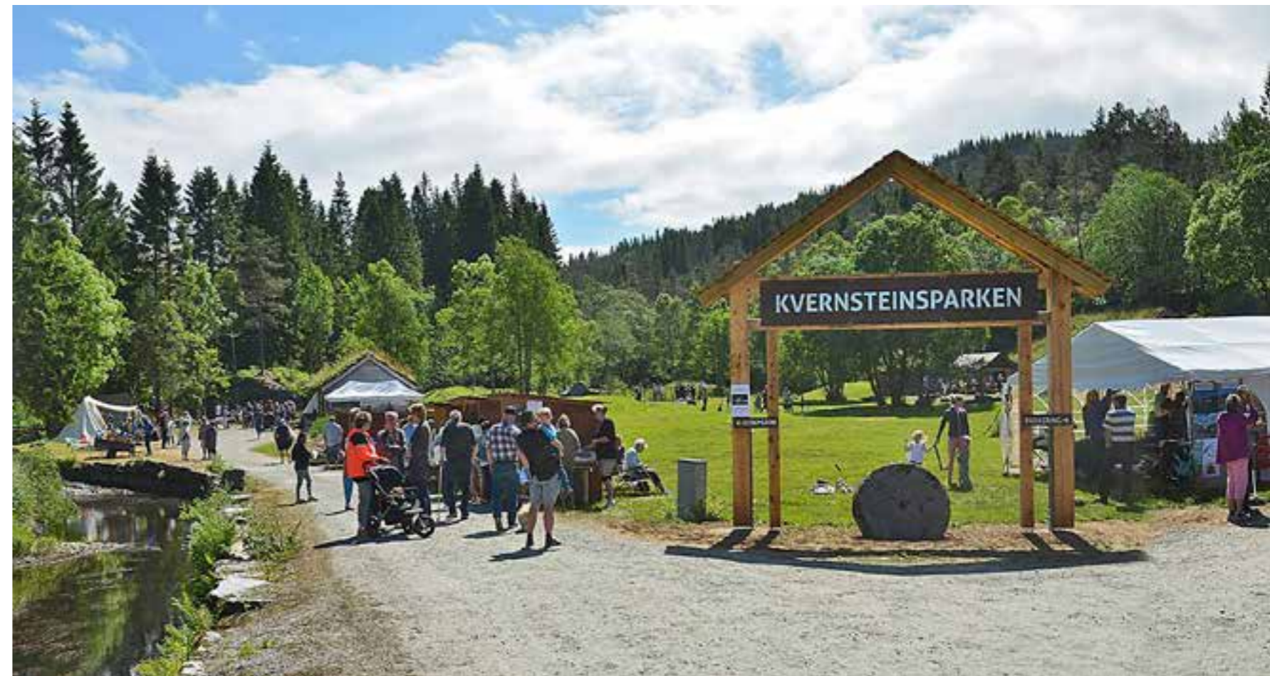
Kvart år arrangerer Norsk Kvernsteinsenter saman med lokale aktørar, kvernsteinmarknaden. Marknadsdagen i 2016 vart eit flott arrangement med 500 besøkande og deltakarar. Høgdepunktet var vikingleikane med Lekegoden og trollet med to «ekte» vikingar som utfordra store og små til historiske leikar som kravde både styrke og uthald.