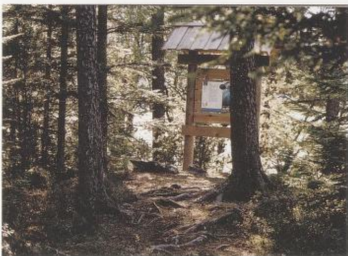
Langs stien er det sett opp fleire emnepostar der ein kan få meir kunnskap om det ein ser rundt seg.

meter over havet. Furua veks på nesten alle jordbottilhøve, men utviklar seg best på middels næringsrik jord og med mykje lys. Særleg når furua er ung veks den raskt.