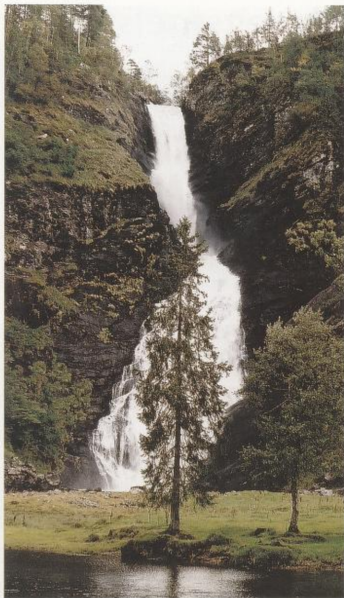
Frå stien har ein god utsikt til Huldefossen som er eit av dei mest populære turismåla i området.

Hagen har eit allsidig vekstskifte med grønnsaker, poteter, korn, grønfôr og eng. I tillegg er det litt bær og krydder. Vekstskifte er å veksle mellom vekstar som gir næring til jorda og vekstar som tærer på næringsinnhaldet i jorda. Eit vekstskifte er også viktig for å hindre sjukdomsangrep og for å redusere ugrasmengda i åkeren. I sesongen får du kjøpt økologiske varer i utsalet ved gartneriet.